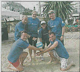
Das engagierte Pharmateam.